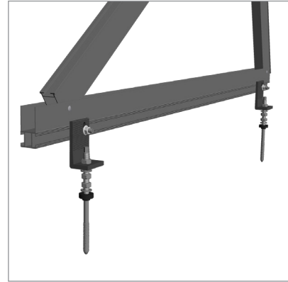
Adaptateur pour vis à double filetage