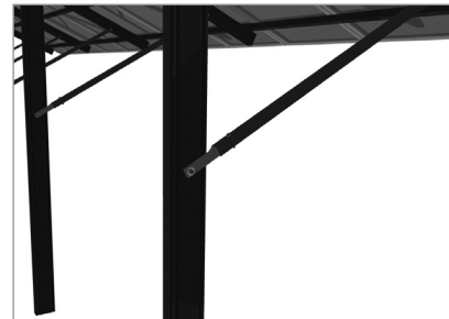
Connexion de la diagonale au poteau C